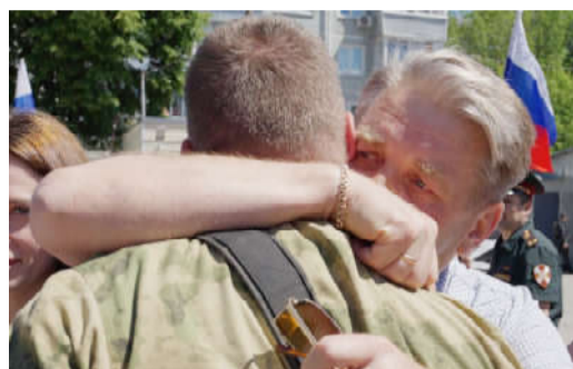
Женщины на вас задачи и внесли неоценимый вклад в будущую победу. Мы гордимся, что в рядах Росгвардии служат такие бойцы!